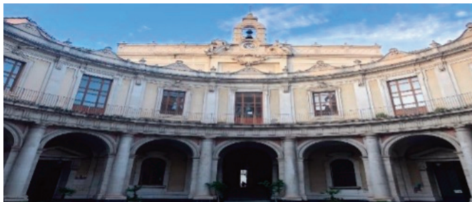
Convitto Nazionale "Mario Cutelli" Via Vitt. Emanuele n. 56