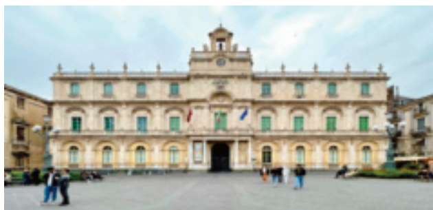
Università di Catania Aula 4 - Palazzo Centrale Piazza Università